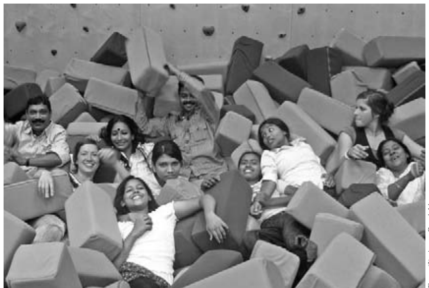
Entspannen von den Reisesträpazen in einer Turnhalle.