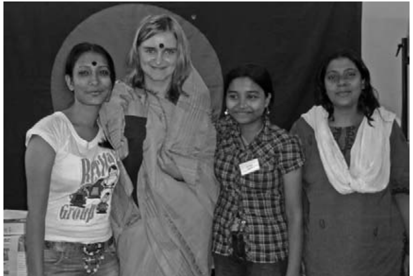
Teilnehmerinnen der Reise auf einer Bildungsveranstaltung in Rottenburg.

Drei Wochen lang vermittelten die Besucher den Teilnehmenden an Veranstaltungen in Schulen, Weltläden und Kirchengruppen in Nordrhein-Westfalen und Baden-Württemberg einen Einblick in die Entwicklungsarbeit und in ihr Leben in Bangladesch. Am Michael-Ende-Gymnasium in Tönisvorst führten die Besucher gemeinsam mit deutschen Schülerinnen und Schülern ein Theaterstück vor eine begeisterten Publikum auf. In Ravensburg beteiligten sie sich an einem Sternmarsch für Kinderrechte; Anlass war der Auftakt der Aktionswochen „Kinder brauchen eine Zukunft“ des Ravensburger Arbeitskreises „Agenda 21“. NETZ organisierte die Reise im Rahmen des vom Bundesministerium für wirtschaftliche Zusammenarbeit und Entwicklung ins Leben gerufenen „Entwicklungspolitischen Schulaustauschprogramms“ (ENSA). Ende 2007 waren neun Schülerinnen sowie eine Lehrerin und ein Lehrer aus Baden-Württemberg nach Bangladesch gereist.