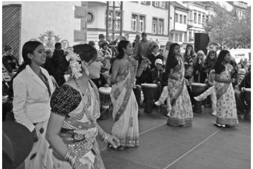
Auftritt in Ravensburg anlässlich einer Aktionswoche.